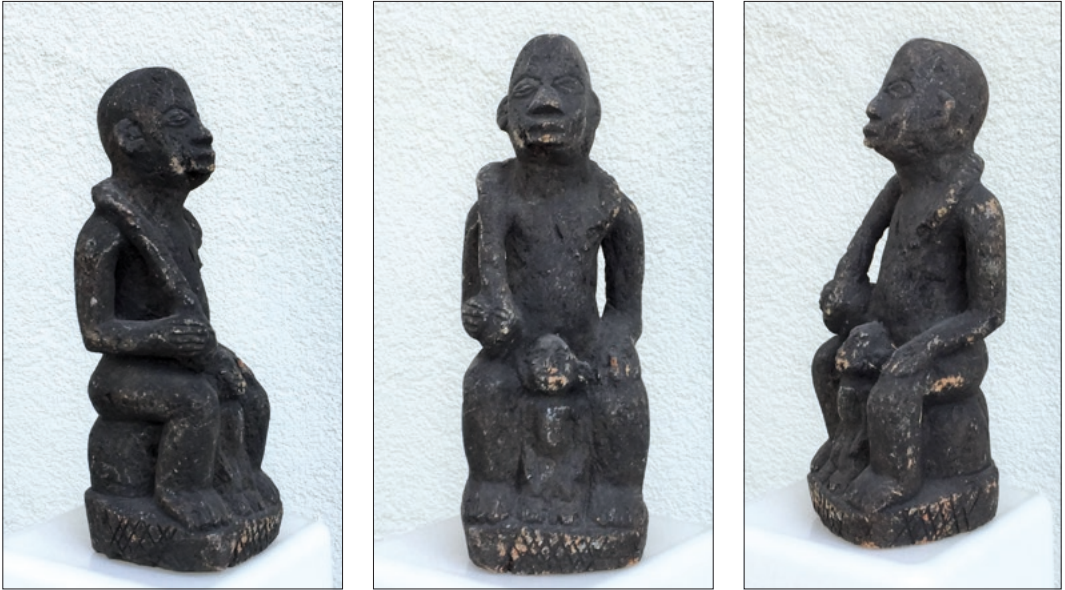
Figuur 1a, b en c. Afbeeldingen van het beschreven beeld / Figure 1a, b and c. Pictures of the described sculpture.

gebeeld met volle borsten, hoogzwanger of als een Madonna in een moeder-kindcombinatie. Dienaren of overwonnen geboeide tegenstanders worden geknield weergegeven.