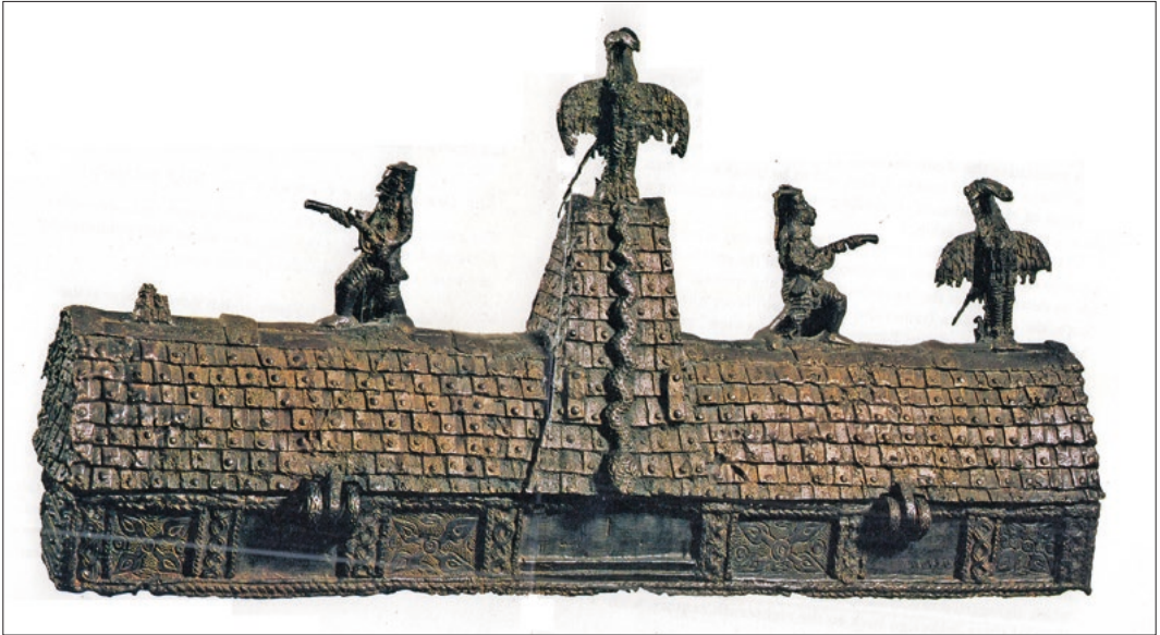
Figuur 8. Slang op het dak / Figure 8. Snake on the roof. Uit/Taken from Preston Blier (1998).

willen worden en indruk te maken op hun tegenstanders. Hier wordt vooral hun vermogen benadrukt om krachtdadig en dodelijk te zijn als het nodig is.