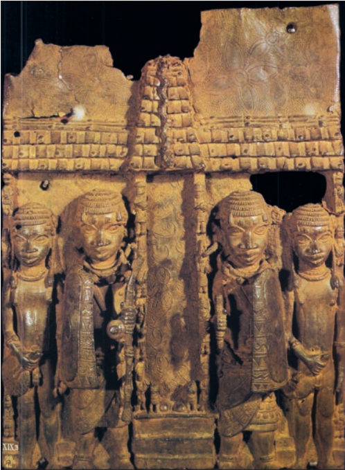
Figuur 6. Poort van het koninklijk paleis van Benin met een python / Figure 6. Gate of the royal palace with a python. Uit/Taken from Meyer (2001).

van de toren tot de grond reikte. De boodschap was duidelijk: je gaat hier binnen in het paleis van een machtig koning. En duidelijk was ook dat die zich vereenzelvigde met de gevaarlijkste python. De python die zich uit een boom laat vallen. 'Ik kan me gedragen als de gevaarlijkste python die antilopen en mensen eet'.