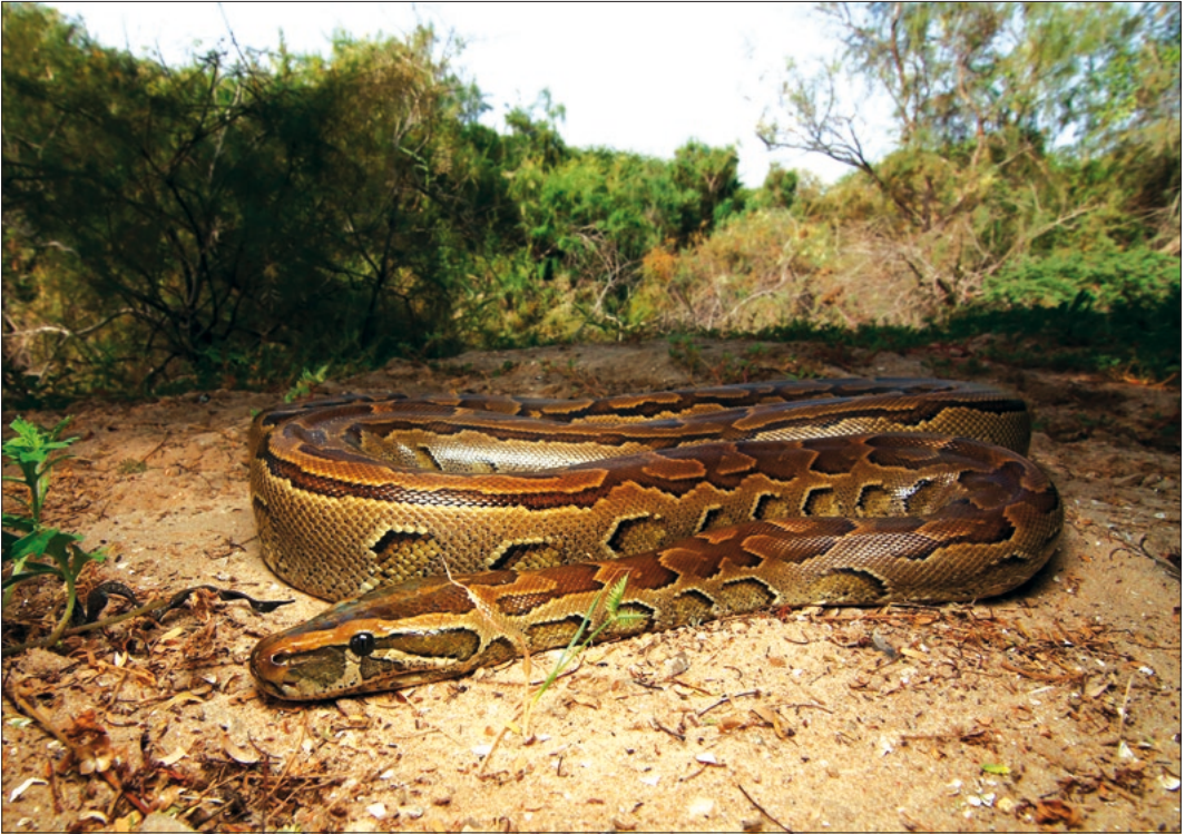
Figuur 3. De relatief agressieve Python sebae , Nationaal Park Diawling, Mauritanië / Figure 3. The relatively aggressive Python sebae . Diawling National Park, Mauritania.

de wat aggressievere rotspython ( Python sebae ) en de zuidelijke Afrikaanse python ( Python natalensis ).