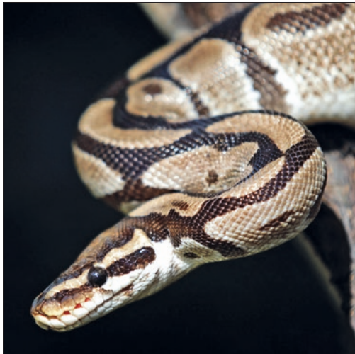
Figuur 2 / Figure 2. Python regius , Foto/Photo F. Perroux.

In Congo komen drie soorten pythons voor. De niet-agressieve koningspython ( Python regius ),