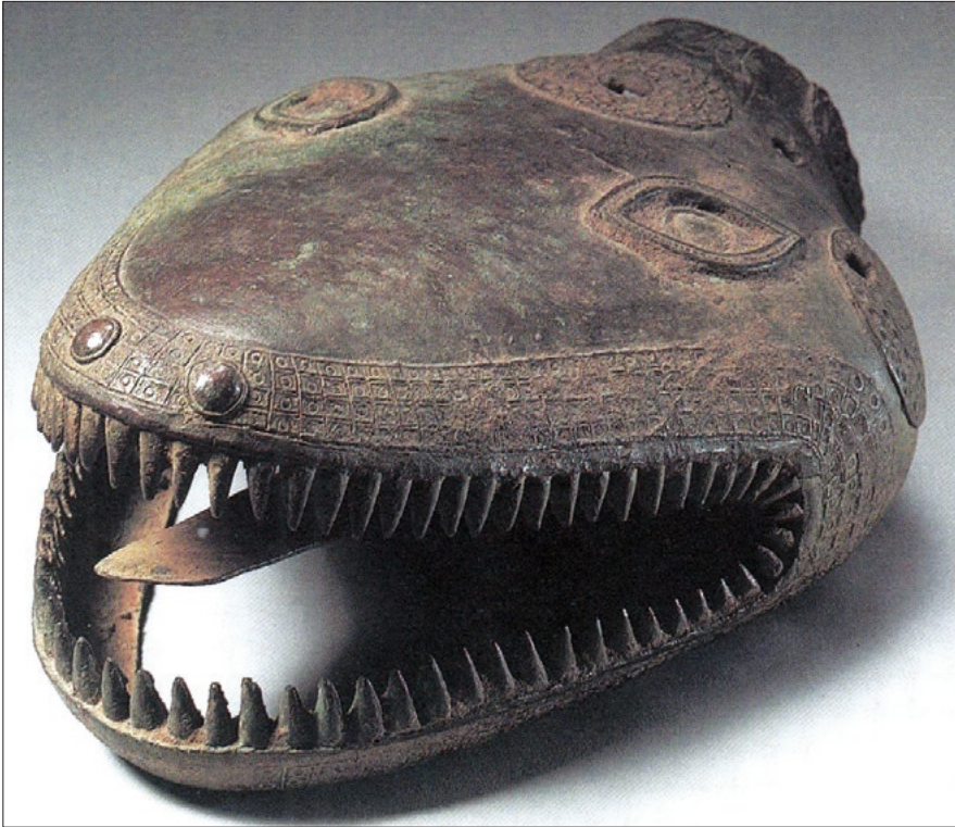
Figuur 4. Koperen kop van een python, Benin. / Figure 4. Copper head of a python, Benin. Uit/From: Preston Blier (1998).

De andere in Congo voorkomende pythons, de rotspython ( Python sebae ) en de zuidelijk Afrikaanse python ( Python natalensis ) zijn van een heel ander kaliber. Deze soorten kunnen meer dan vijf meter lang worden, zijn relatief agressief en kunnen grote zoogdieren, zoals antilopes, luipaarden en zelfs soms een mens doden en opeten. Ze kunnen goed zwemmen en zich over land bewegen. Hun prooien vallen ze vaak aan door zich vanuit een boom er bovenop te laten vallen. Vervolgens wurgen ze die en slikken ze dan door.