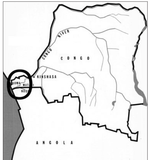
Kaart 1. Gebied waar dit soort beelden vandaan kwam (zie tekst) / Map 1. Area where this kind of statuettes came from (refer to text).

A typical kind of stone statuettes originates from the region of the lower course of the Congo river, bounded on the south side by Angola and on the other side Congo. These statuettes, that are called mintadi or ntadi, were manufactured in the period 1850-1930. It is remarkable that they are made of stone. This is surprising because the majority of African statues are carved from wood. On second thought however, this is less strange than it seems. The material from which they are sculpted consists of steatite or soapstone. In order to make a statue, the steatite is dug as a kind of clay from the riverbed or 'stone-quarry'. Subsequently the sculptor carves a statue from the wet soft clay with a woodcarving technique. After fini-